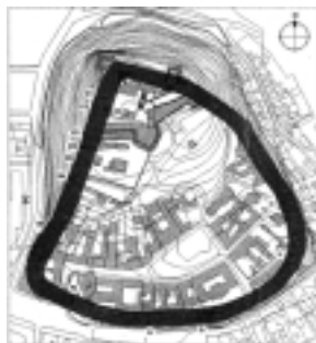
Na mapke je priebeh širokého komorového valu na hradnom kopci. P. Bednár

Dolný palánok sa okolo roku 1850 nazýval ako