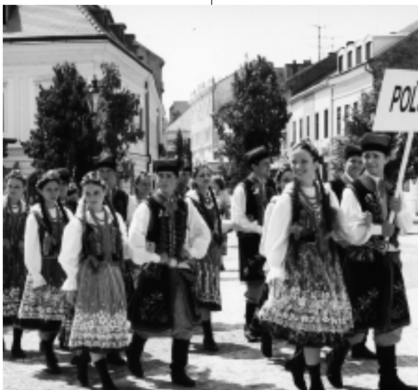
Spravidelným podujatím festivalu bude festivalový sprievod mestom.

Súčasťou festivalu bude aj Medzinárodná vedecká konferencia s názvom „Význam kultúrneho dedičstva sv. Cyrila a Metoda pre Európu“, ktorá sa uskutoční v stredu 2. júla na UKF