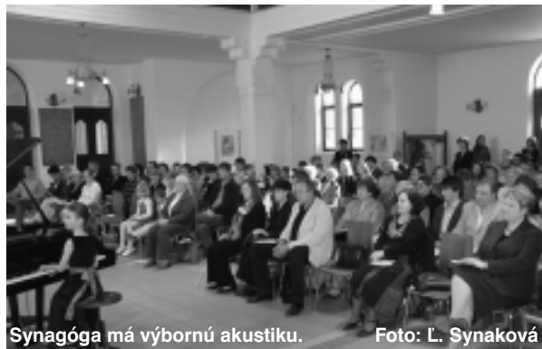
Synagóga má výbornú akustiku.