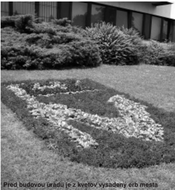
Pred budovou úradu je z kvetov vysadený erb mesta