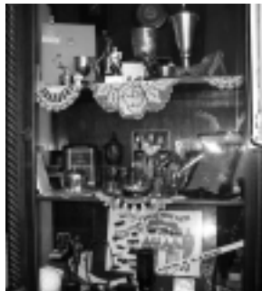
Vitrína so športovými trofejami